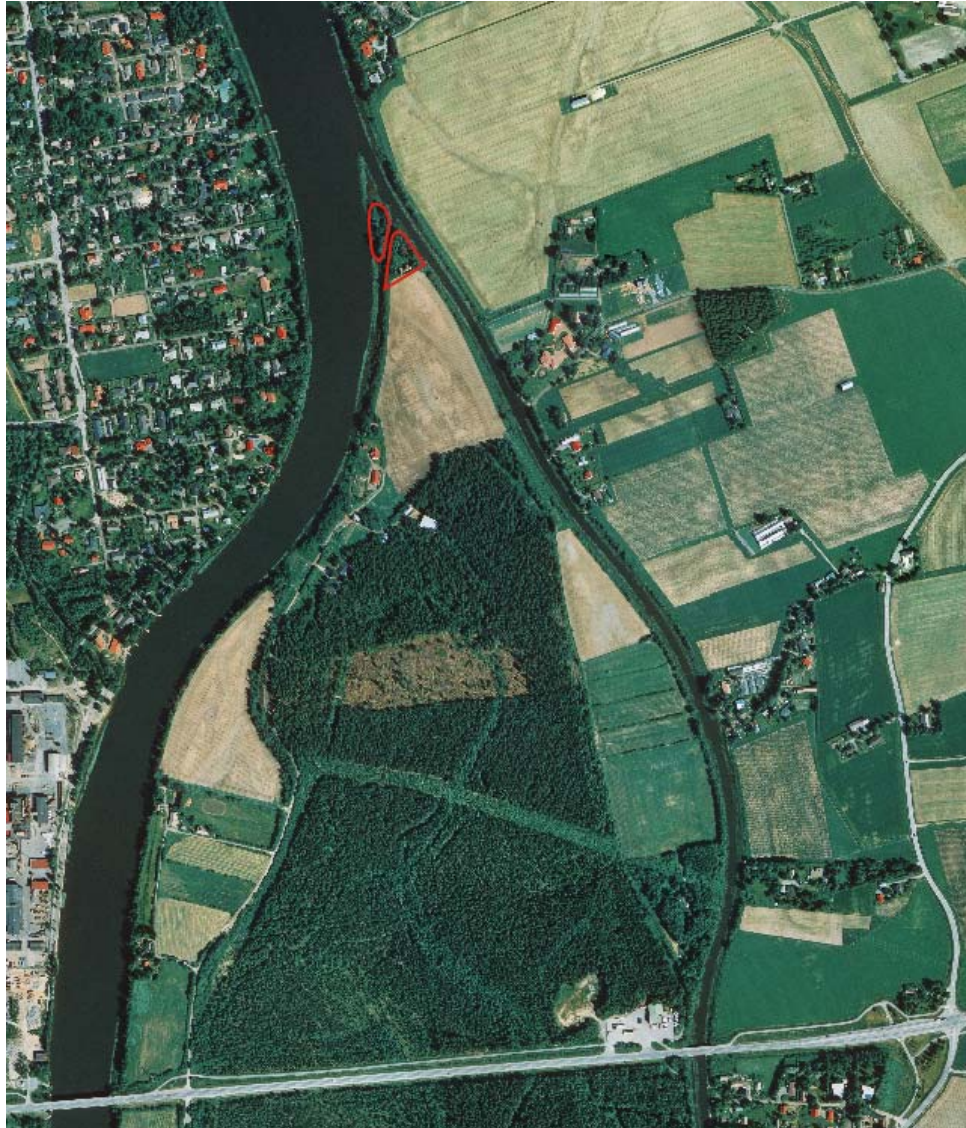
Kuva 2: Ilmakuva Saarenluodon pohjoisosasta. Suunnittelualue on merkitty punaisella.