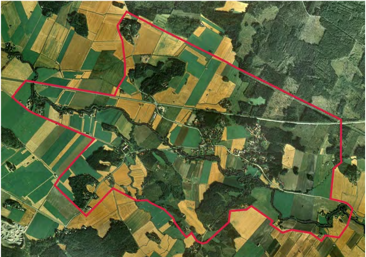
Suunnittelualan alustava rajausta ortokuvassa

Suunnittelualan muodostavat Kaasmarkun kylän keskusta sekä sitä ympäröivät maa- ja metsätalousalueet, joiden yhteenlaskettu pinta-ala on noin 630 ha. Idässä suunnittelualue rajautuu Solan ja Ojalan tiloihin, etelässä Latomäkeen ja lännessä Kivimäkeen, Suolistontiehen ja valtatiehen 11. Pohjoisessa ja etelässä suunnittelualue ulottuu noin 0,5...1,5 km:n etäisyydelle valtatiestä.